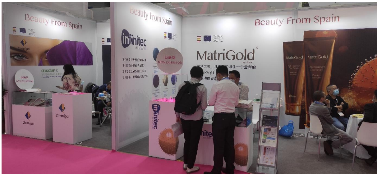
FPA PCHI 2021.

Los gastos personales derivados del viaje (vuelos, alojamiento, traslados, dietas, etc.) correrá a cargo de cada empresa participante. Stanpa les apoyará en la gestión del viaje y negociará tarifas especiales de alojamiento con los hoteles recomendados por la propia feria.