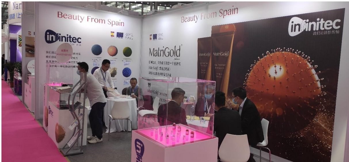
FPA PCHI 2021.