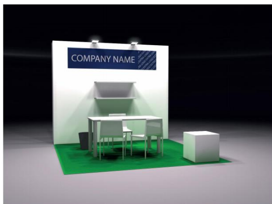
Stand predecorado de 9m2