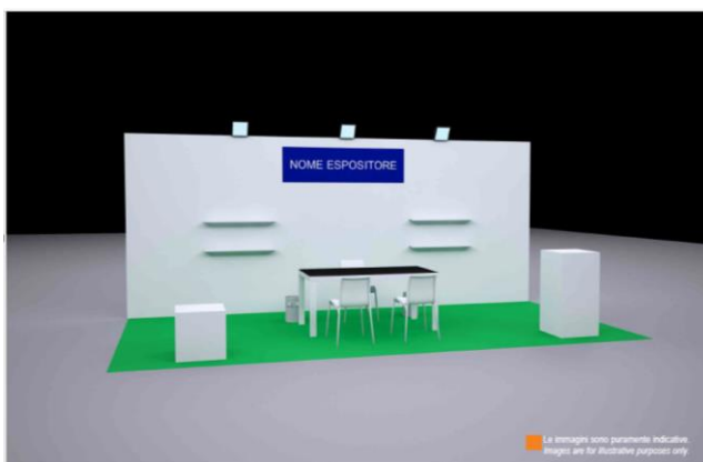
Stand predecorado de 18m2