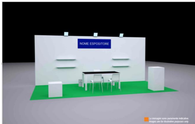
Stand predecorado de 18m2