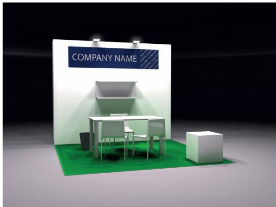
Stand predecorado de 9m2