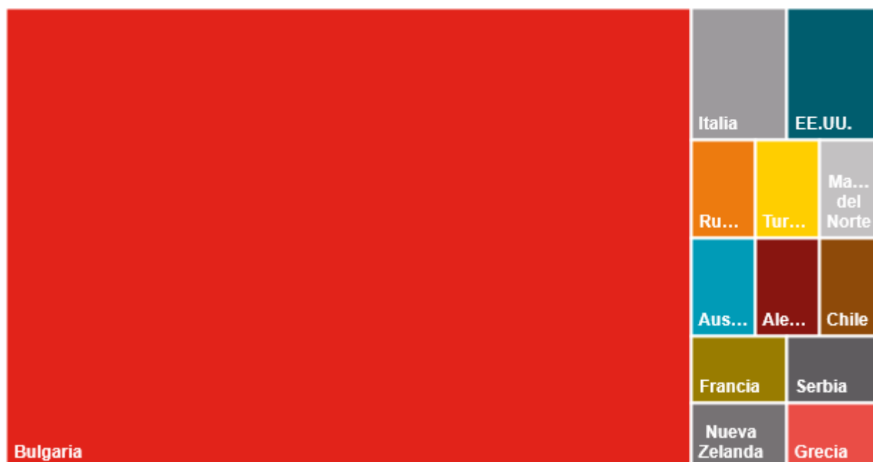
GRÁFICO 1: REPRESENTACIÓN POR PAÍSES DE LOS PARTICIPANTES DE LA FERIA